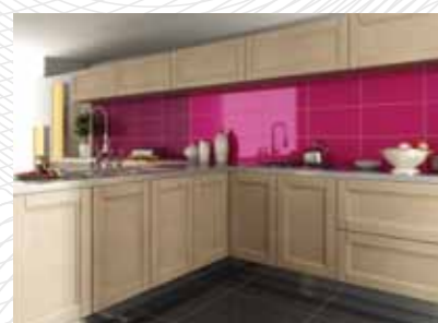
ЦВЕТА (1 – ДУБ FT, 2 – ЯСЕНЬ FT)

2. ФИЛЕНКА: КОНСТРУКЦИЯ – плоская МАТЕРИАЛ – МДФ с натур. шпоном дуба 1 / ясеня 2 (шпон положен горизонтально) ТОЛЩИНА – 6 mm